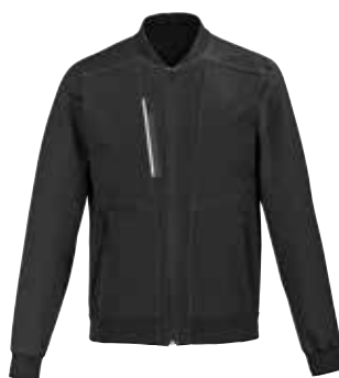
BOMBERS MIXTE MOW