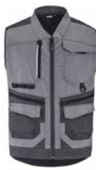
GILET HOMME TROWEL