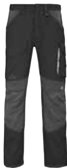
PANTALON HOMME RULER