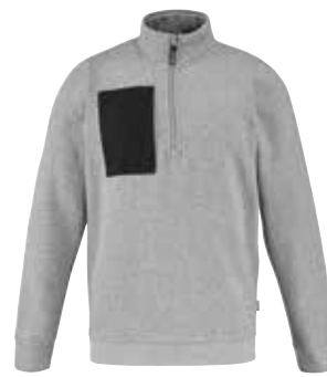
SWEAT DEMI-ZIP SANDSTONE