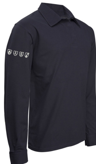
Polo Multirisques anti-chimique

Polo piqué manches longues Multirisques Col chevalier en maille piquée Patte de col fermée par 3 boutons pressions cachés Finition type chemise aux poignets fermés par 2 boutons pressions cachés EPI conforme aux exigences des normes Non feu EN ISO 11612 : 2015 A1 A2 B1 C1 F1 Antistatique EN 1149-5 : 2018 Arc électrique IEC 61482-2 : 2018-4 kA – APC = 1 Protection contre les liquides chimiques EN 13034 : 2005 + A1 : 2009 type PB[6] Lavage industriel selon ISO 15797