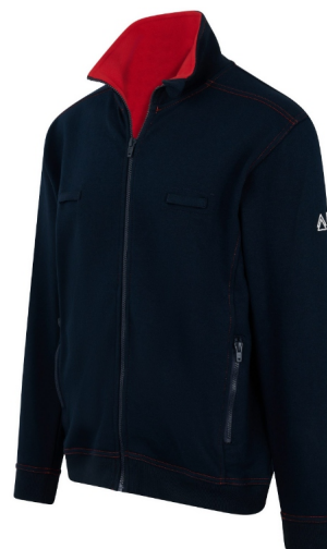
Blouson zippé Marine-rouge