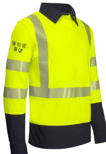
Polo piqué manches longues Multirisques