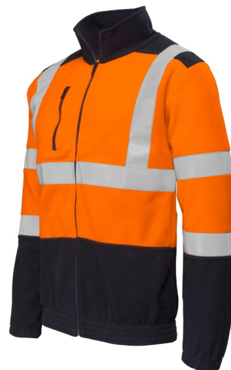
ETNA marine-orange fluo