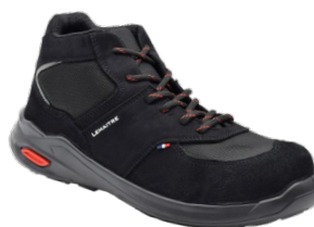
SPEED HAUT NOIR S3S ESD SEEHS3SNR