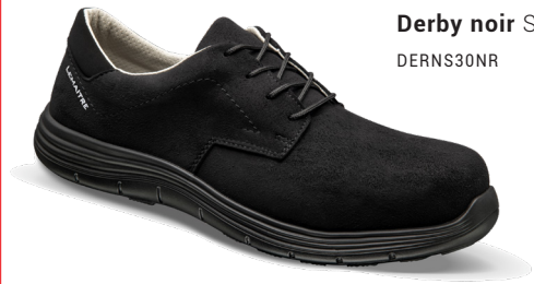
Derby noir S3 SRC DERNS30NR