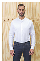
NEOBLU BART MEN 03792