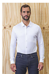
NEOBLU BASILE MEN 03777