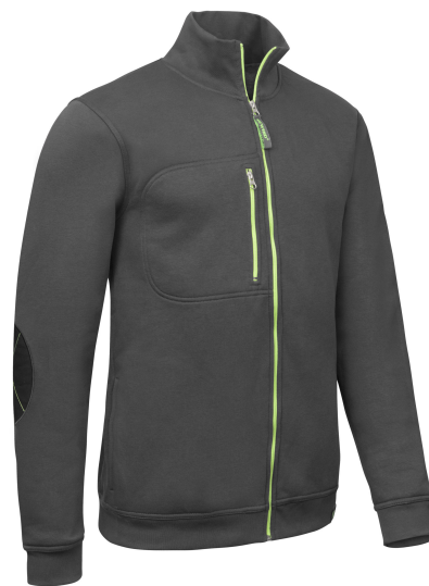
Blouson zippé avec membrane anthracite - anis