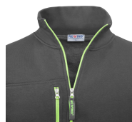
col montant zippé