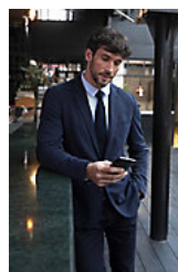
NEOBLU MARCEL MEN