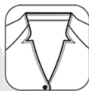
Encolure fantaisie bordé d'un passepoil contrasté