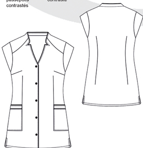
Marques & modèles déposés