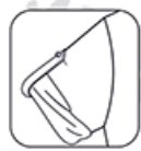
Manches transformables nacrées