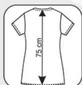
Hauteur milieu dos 75 cm